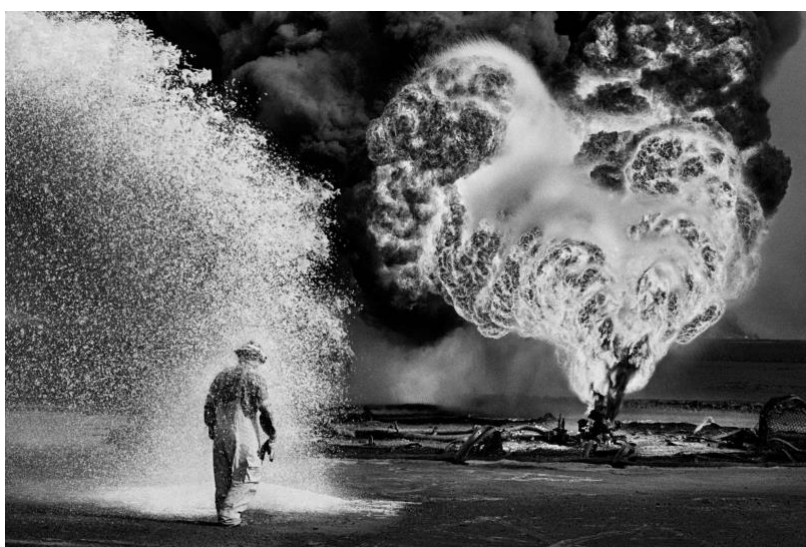
Portrait of Sebastião Salgado, 2019. © Renato Amoroso; Kuwait, 1991. © Sebastião Salgado

La World Photography Organisation a le plaisir d'annoncer que le célèbre photographe brésilien Sebastião Salgado est le lauréat du prix de l' Outstanding Contribution to Photography ( Contribution exceptionnelle à la photographie ) des Sony World Photography Awards 2024. Sebastião Salgado, l'un des photographes les plus éminents et reconnus au monde, a acquis une renommée internationale grâce à ses remarquables compositions en noir et blanc réalisées au cours d'une carrière de plus de 50 ans.